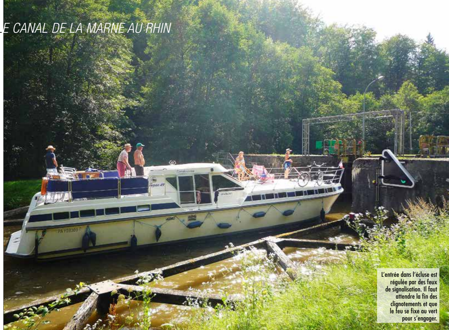
L'entrée dans l'écluse est régulée par des feux de signalisation. Il faut attendre la fin des clignotements et que le feu se fixe au vert pour s'engager.

Les Canalous nous ont proposé une croisière en aller simple au départ de Waltenheim-sur-Zorn vers Languimberg, sur une semaine. Les parcours sont à la carte, et il est possible de faire un aller-retour. Il existe un service de rapatriement de véhicules, mais nous avons choisi d'emprunter des taxis. La large flotte des Canalous permet de partir dans toutes les configurations, à bord d'un petit bateau pour un couple ou d'une grande péniche familiale, le tout dépendant du budget et du profil. Notre cahier des charges était clair : étant quatre couples, nous voulions quatre salles d'eau avec des WC indépendants pour