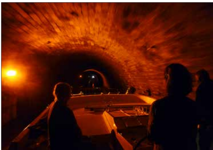
Les souterrains d'Arzwiller et de Niderviller sont une percée de 2 800 mètres vers l'inconnu.