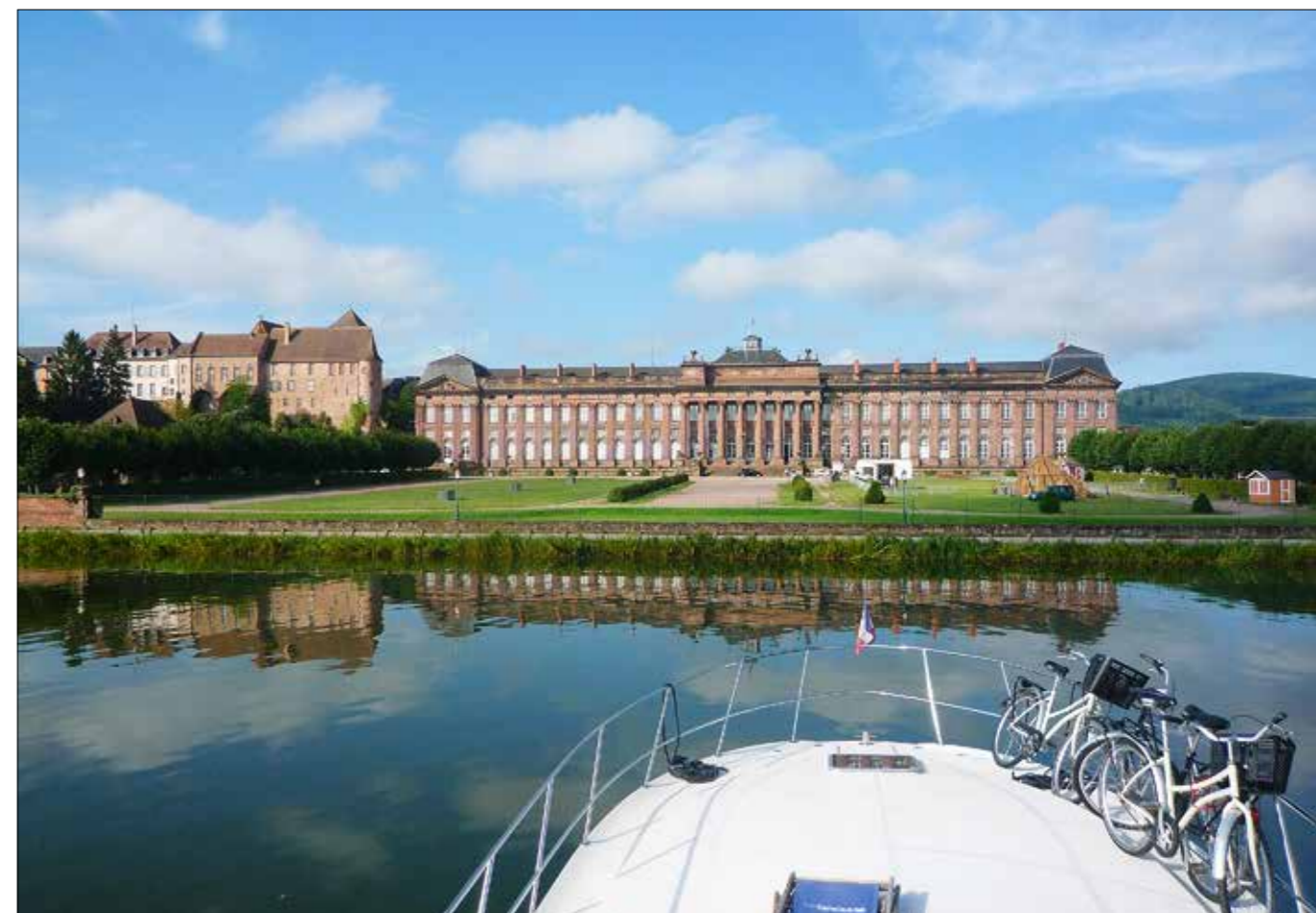
Étape dans le port de Saverne face à son majestueux château. C'est un lieu de ravitaillement choisi et un point de départ idéal pour visiter la ville.