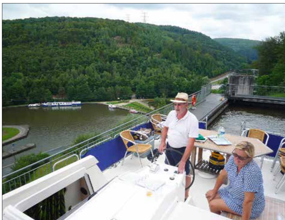
L'ascension sur le plan incliné de Saint-Louis-Arzviller offre une vue à couper le souffle sur la nature environnante.

En péniche, la présence de la nature est permanente et permet de découvrir la faune et surtout les oiseaux qui peuplent les canaux (poules d'eau, cygnes, colverts, ragondins, mésanges, buses, grenouilles, libellules...), mais aussi les animaux de la ferme qui broutent dans les herbages. Force est de constater que le tourisme fluvial offre une totale connexion avec le quotidien. Quoi de plus ressourçant que de se laisser glisser lentement au fil de l'eau pour admirer l'envol d'un héron ou les majestueux châteaux qui se dressent sur des berges... Et si l'envie prend de visiter un vignoble ou de déjeuner dans une guinguette, il suffit de descendre les vélos embarqués ou de commander un taxi, de nombreuses sociétés se trouvant à proximité. Pour le ravitaillement, des épicerie et des petits commerces existent dans la plupart des villages traversés, tout comme les marchés. Cette première balade en péniche nous a permis de redécouvrir la nature, d'adopter un autre rythme, sans aucune contrainte de temps et d'horaires, mais sans oublier non plus que l'aventure possède aussi son petit côté dynamique. ■