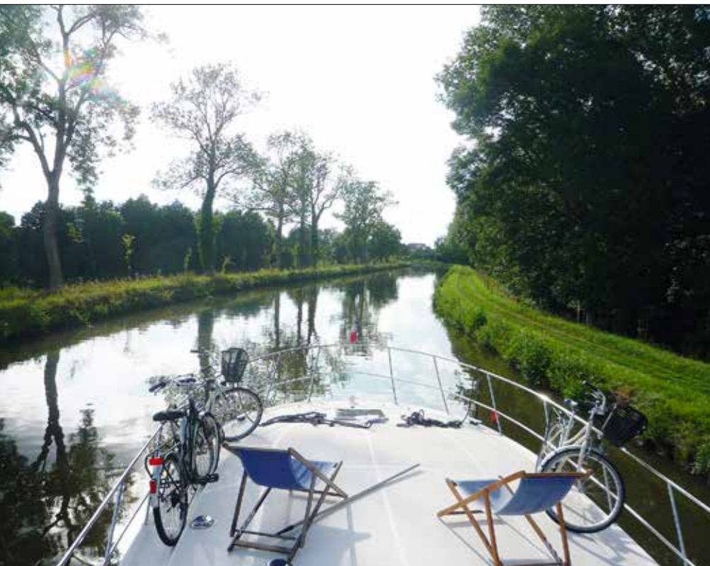
La balade sur le canal appelle à la détente, mais rien n'empêche d'emprunter les voies cyclables !

se promener ou faire du vélo sur les chemins de halage est également possible, grâce au kit d'amarrage. Piquets et marteau sont fournis. La navigation nocturne est toutefois interdite. Les éclusiers arrêtant leur service un peu avant 19 heures, il est préférable d'anticiper ses temps de trajet, si une étape dans un port est prévue pour faire le plein d'eau, par exemple. Sinon, l'autonomie du bateau permet de passer la nuit en toute liberté le long de la berge.