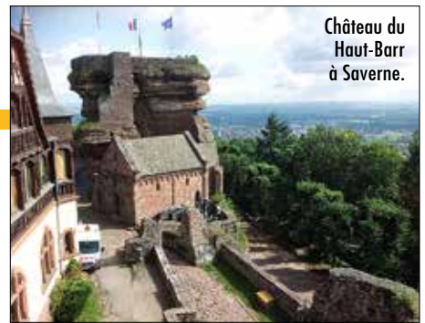
Château du Haut-Barr à Saverne.

qui vous sera remise par les éclusiers. Il faut bien respecter les feux de signalisation à l'entrée et à la sortie de chaque écluse. Gaffe et cordage en main, il convient de centrer le bateau et de s'amarrer solidement, surtout lorsque le canal est remonté. Certaines écluses exigent une petite préparation et même le port d'un gilet de sauvetage... un rappel à l'ordre nécessaire dont se chargent les éclusiers garants de la sécurité des passagers.