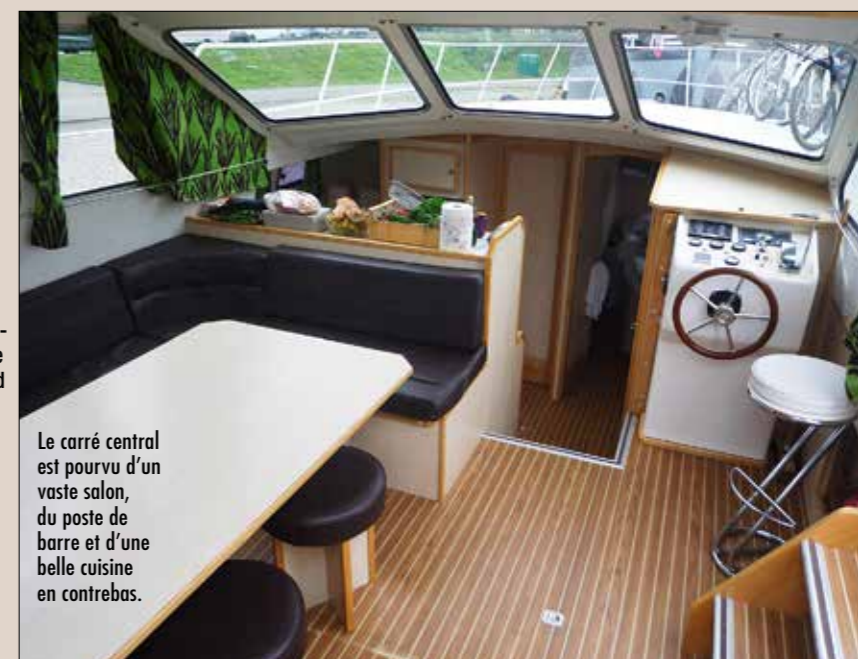
Le carré central est pourvu d'un vaste salon, du poste de barre et d'une belle cuisine en contrebas.

Tarif modèle testé : à partir de 2 772 € la semaine.