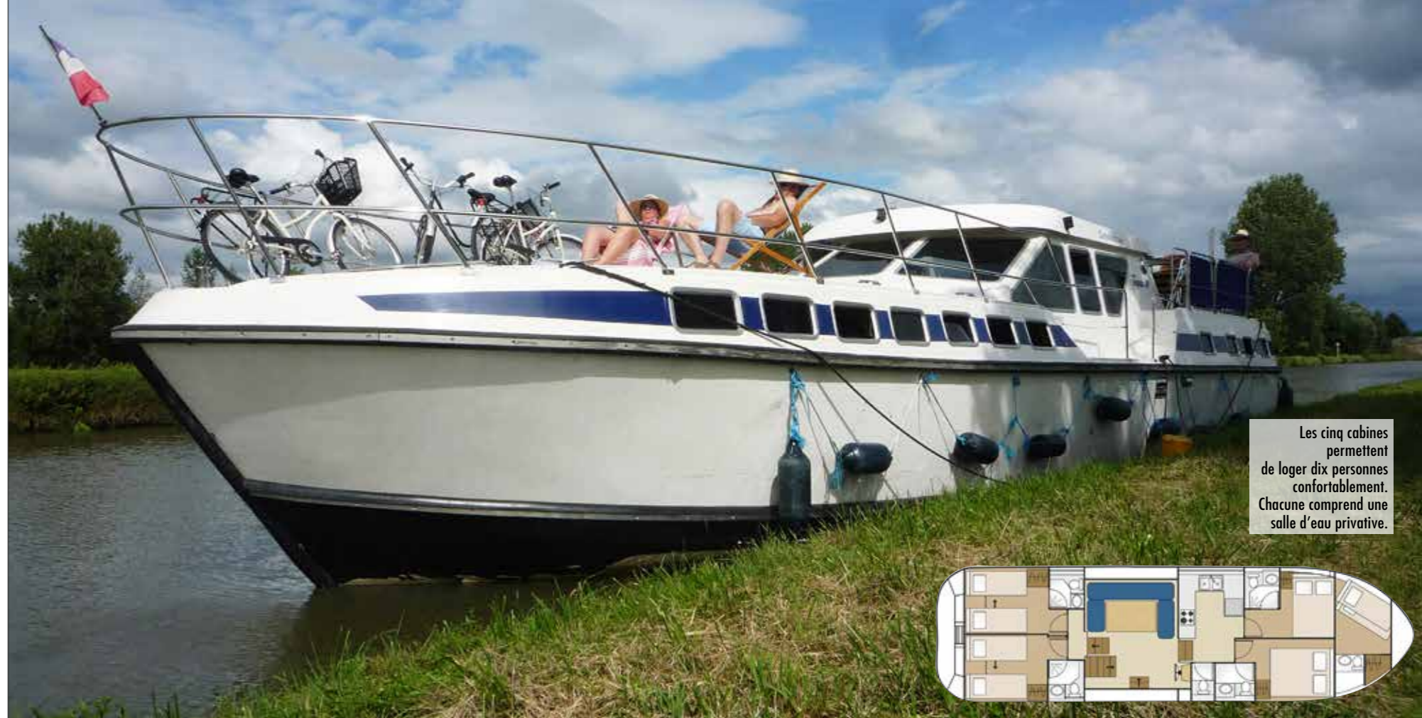
Les cinq cabines permettent de loger dix personnes confortablement. Chacune comprend une salle d'eau privée.