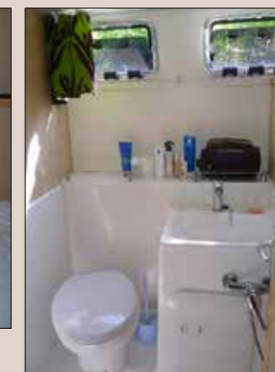
Chaque salle d'eau bénéficie d'une douche. Le nettoyage et le séchage sont rapides grâce à une bonne aération.