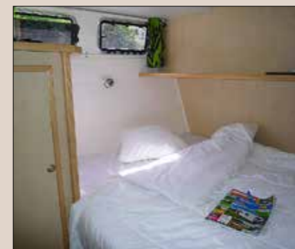
Les cabines sont lumineuses, aérées et équipées de grands rangements et de lits de 1,40 à 1,60 m.