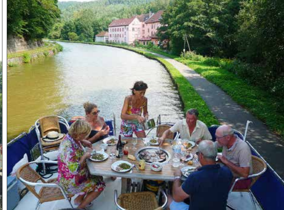
Le kit d'amarrage permet de s'arrêter sur la berge, le temps d'un déjeuner ou d'une visite improvisée.